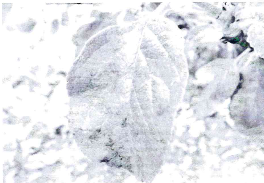
Rapan la măr

- Rapan, fainare, omizi defoliatoare, afide - la culturile de măr și par