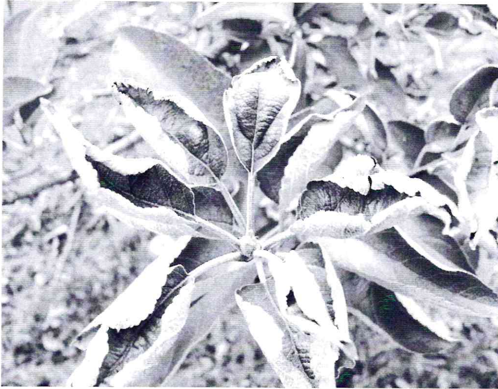
Fainare la măr