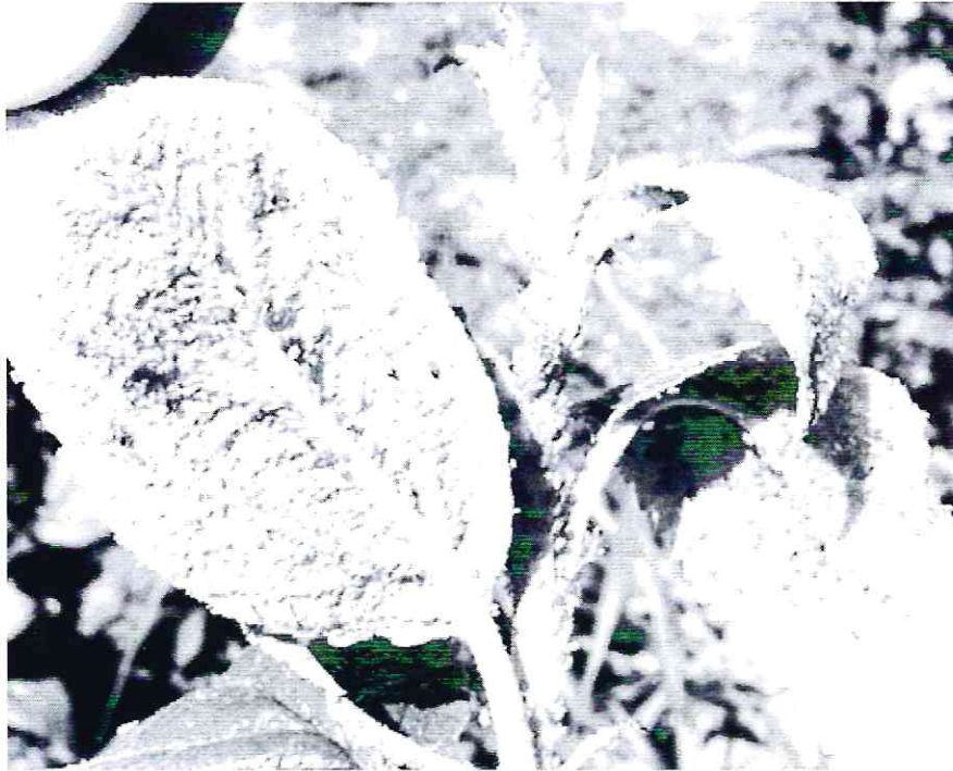
Afide la mar